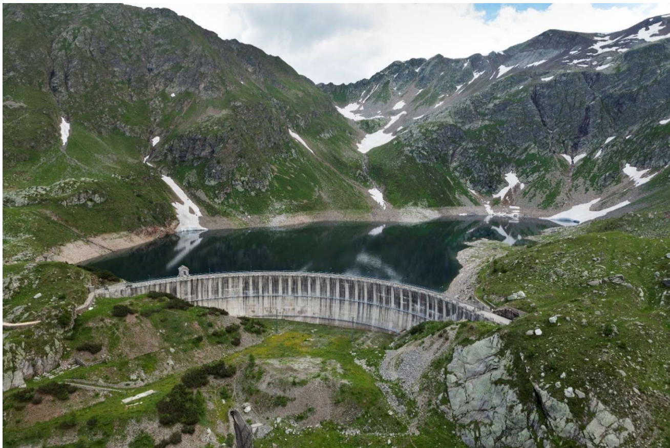
Diga di Publino e bacino della centrale Publino

Strada Argine Goleana Destra - 26847 Maleo (LO)