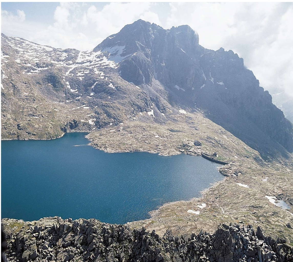
Il Lago della Vacca

Ubicazione della sede: Via del Lavoro, 7/1 - 33013 Gemona del Friuli (UD)