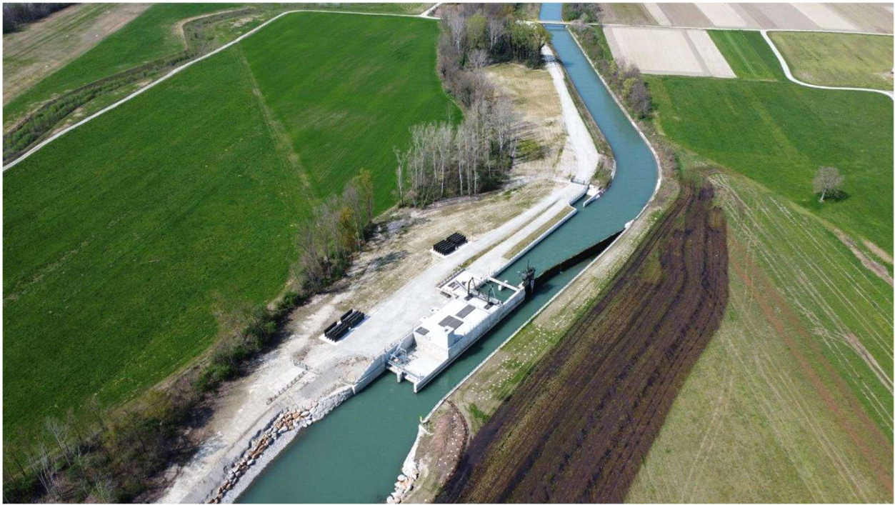
Nuovo impianto di Montalto II